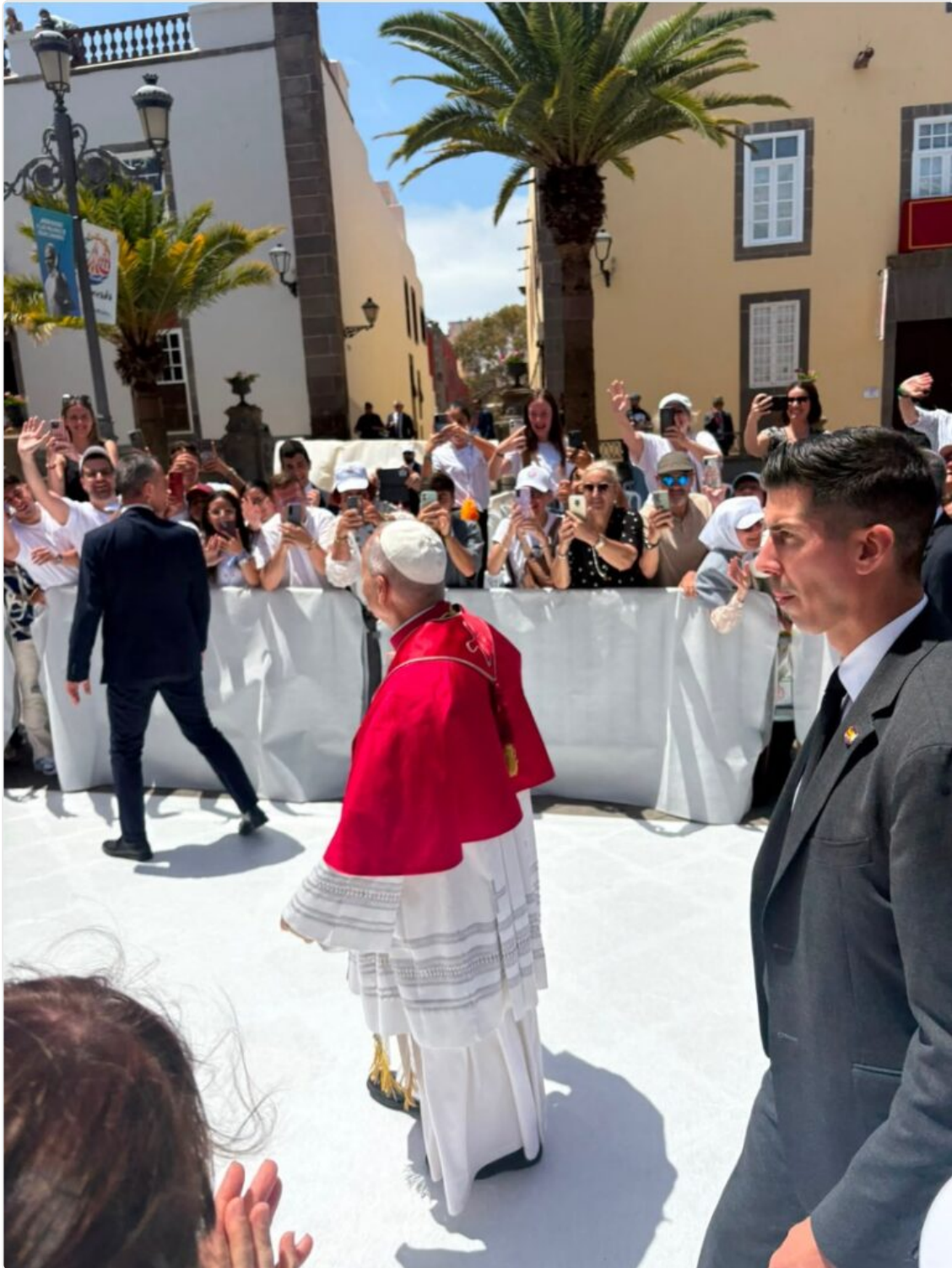
León XIV en Canarias